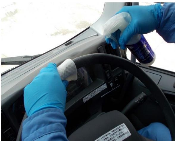
車両内の消毒 (ステアリング)