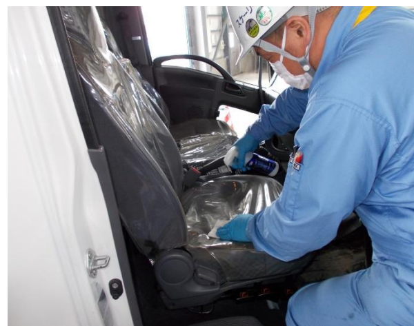
車両内の消毒 (シートカバー)